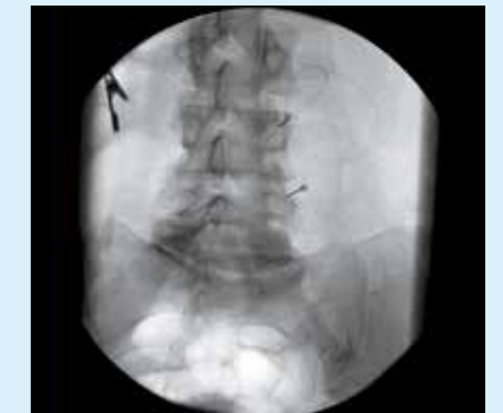
Процедура лечения болевого синдрома – система BV Endura позволяет врачам визуализировать введение иглы в области позвоночника.