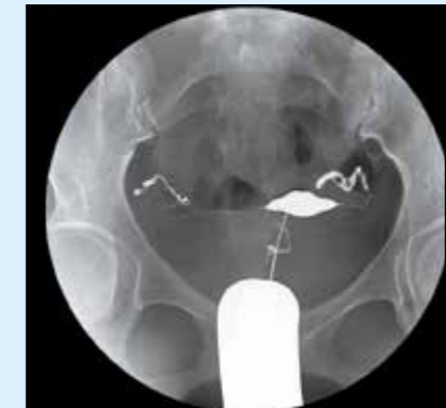
Гистеросальпингография – эти процедуры все чаще выполняются с использованием передвижных рентгенохирургических систем. Система BV Endura предлагает превосходное качество изображений для поддержки таких исследований.