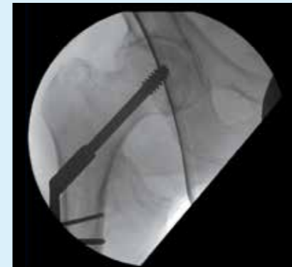
Передняя проекция тазобедренного сустава – система BV Endura повышает качество изображений и контролирует дозу рентгеновского излучения путем применения одной шторки для визуализации динамического винта.

Полностью цифровая цепь формирования изображений с матрицей 1024x1024 включает в себя мощные функции обработки изображений, например усовершенствованное шумоподавление и подчеркивание контуров в двумерных изображениях, что стабильно обеспечивает высокое качество изображений. Она поддерживает рентгеноскопию высокого качества, субтракционные серии и режимы картирования (роадмэп), помогая хирургам в выполнении сложных ортопедических и сосудистых процедур. Это пригодится для широкого спектра задач – от помощи при сложных переломах до малоинвазивных процедур на сосудах.