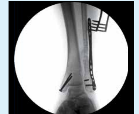
Перелом голени – система BV Endura обеспечивает отличное качество изображений даже без применения шторок, что упрощает рабочий процесс.