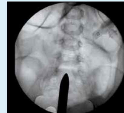
Исследование брюшной полости ребенка – это изображение обеспечивает высококачественную визуализацию всей брюшной полости при низком уровне дозы.