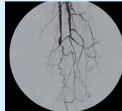
Ангиография нижних конечностей в режиме ЦСА позволяет визуализировать детали мелких сосудов с превосходным качеством.